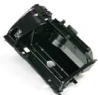
Handschuhkasten Glove compartments