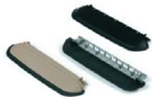
2K Abdeckung 2K covers