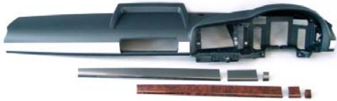
Instrumententafel Instrument panels