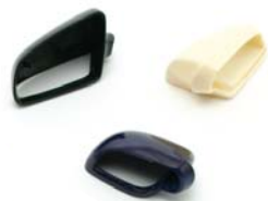
Außenspiegelgehäuse Side mirror housings